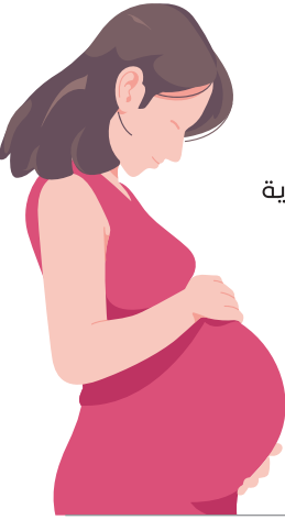
معدلات المواليد بعملية قيصرية حسب المسوح الأسرية